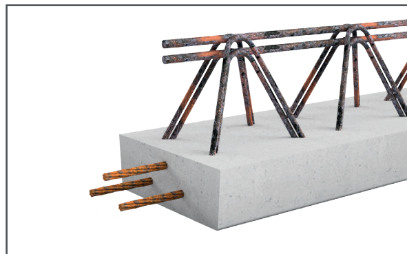
PPR 20 x 7